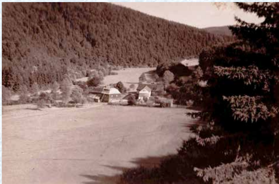
Údolí Zbirožského potoka se Zimovým mlýnem (30. léta 20. století)