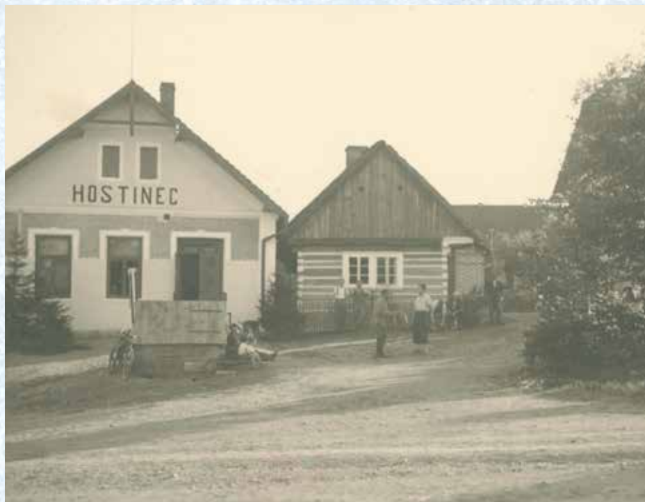
Ochotnické divadlo na návsi těsně před 2. světovou válkou. Chaloupka předdomy č. p. 10 a 29 byla zbourána v roce 1967.