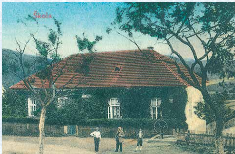
Budova školy (1920).