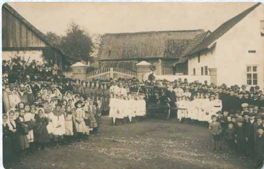
Slavnostní svěcení hasičské stříkačky v Ostrovci dne 10. května 1914.

Sbor byl založen 29. 6. 1913 a již v tomto roce se stal členem hasičské župy zbirožské. Ještě téhož roku se výbor sboru usnesl a zakoupil čtyřkolou stříkačku. V dubnu roku 1914 byl zřízen ženský sbor se sedmi aktivními členkami a v květnu téhož roku se uskutečnilo slavnostní svěcení stříkačky za přítomnosti všech členů a mnoha hostů z kraje. Sbor vykonával pravidelná cvičení, byla zřízena sborová škola, která pod vedením jednatele připravovala teoreticky členy na různé situace. Hasiči každoročně také pořádali oblíbený reprezentační ples v místním hostinci U Pazáků. Pamětníci vzpomínají na obdivuhodnou pohotovost a obětavost členů sboru, kteří zasahovali u mnoha místních i vzdálenějších požárů.