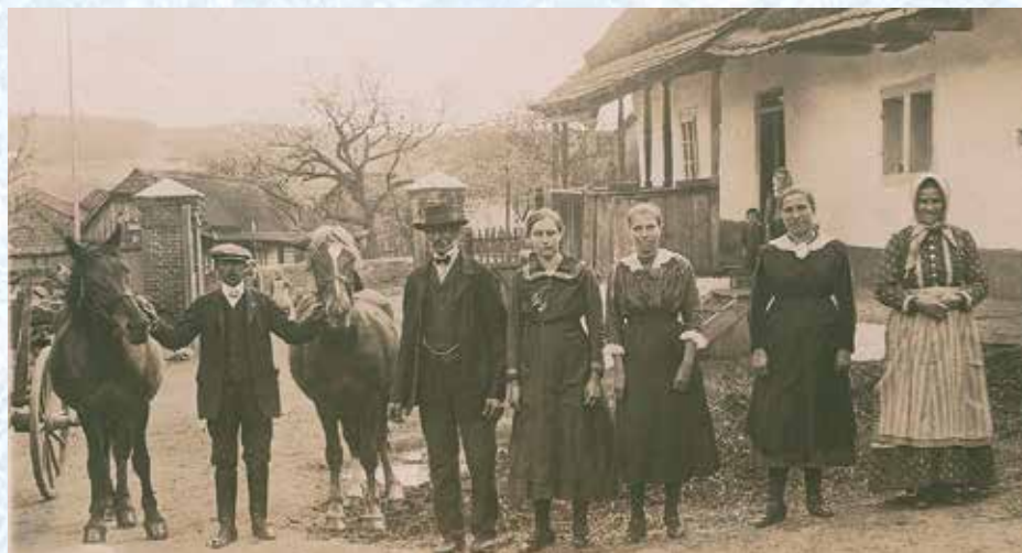
Statek „U Svobodů“ č. p. 5 se svými obyvateli (1915).