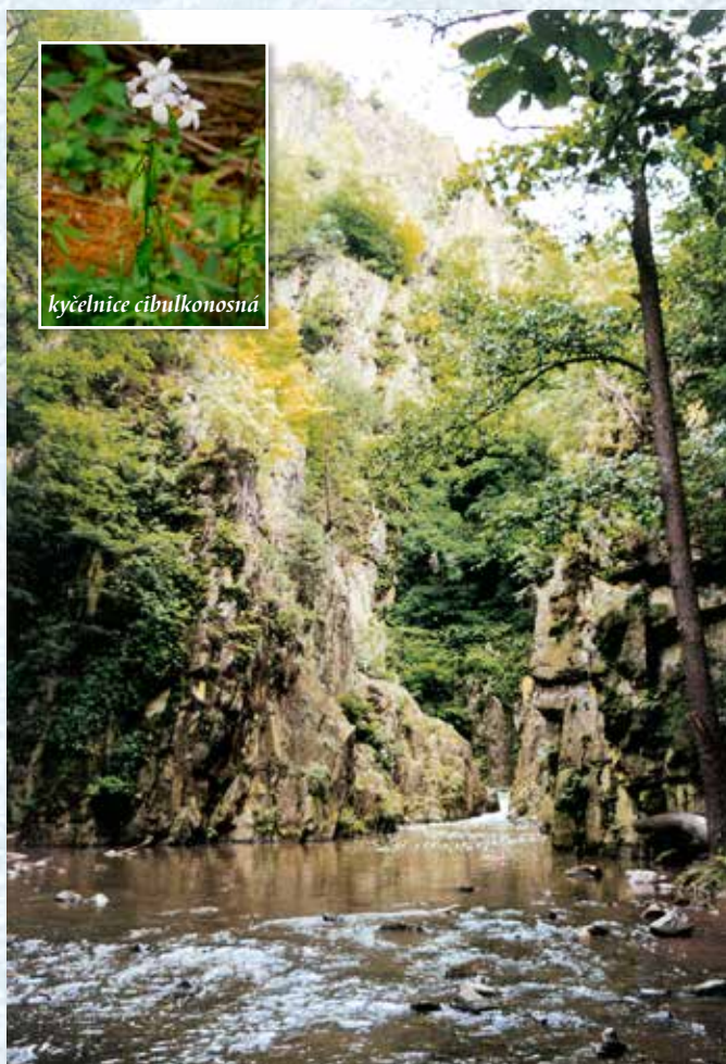
Skryjská jezírka v kaňonu Zbirožského potoka.

Pod Ostrovcem nad levým břehem Zbirožského potoka se nachází Lípa - přírodní rezervace, vyhlášená v roce 1990. Na suťovém podkladu tu rostou buky, javory, samozřejmě lípy i jehličnany a v podrostu 140 druhů cévnatých rostlin. Do katastru Ostrovce patří i národní přírodní rezervace Kohoutov s 30 hektary přirozeného starého porostu buků. Z rostlinek je pozoruhodná kyčelnice cibulkonosná. Je to 30 až 60 cm vysoká lesní bylina, její květ je nafialovělý se čtyřmi okvětními lístky, roste a kvete především ve vlhkých bučinách v květnu až červnu. K zajímavým živočichům patří čáp černý, mlok skvrnitý nebo ropucha obecná.