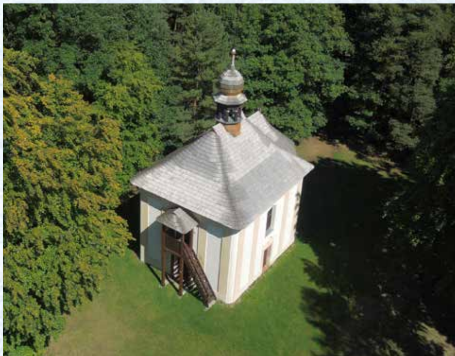
Lesní kaple sv. Vojtěcha je krásně opravená.