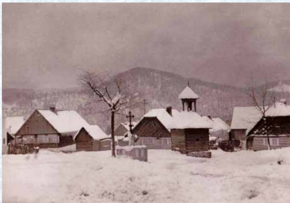
Náves v zimě (30. léta 20. století).