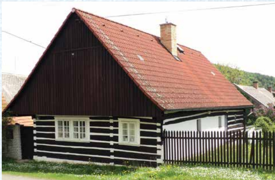
Roubenka Na Tvrzi má sdružená okna.