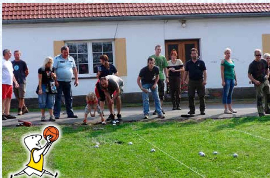
Pétanque – turnaj v metání koulí.