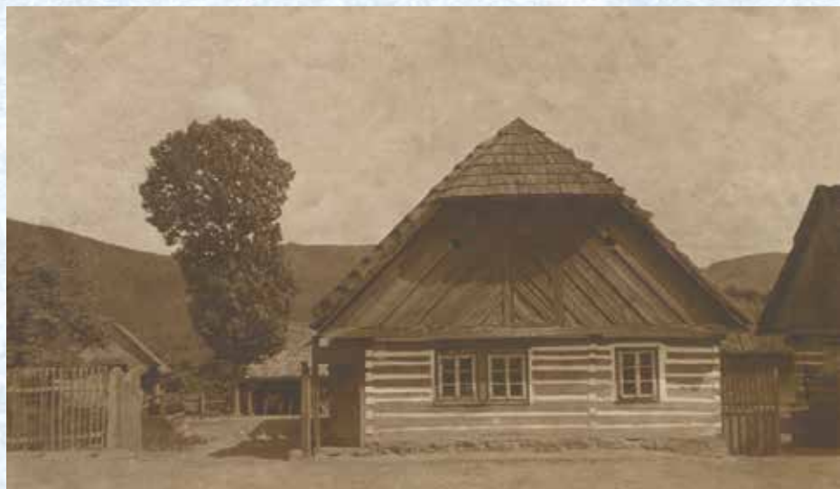
Dnes již nestojící statek č. p. 4 „U Čiháků“.

Osudy lidí i domů zevrubně popisuje kronikářka obce paní Jarmila Vávrová v Popisu obyvatel a domů v Ostrovci z roku 1997.