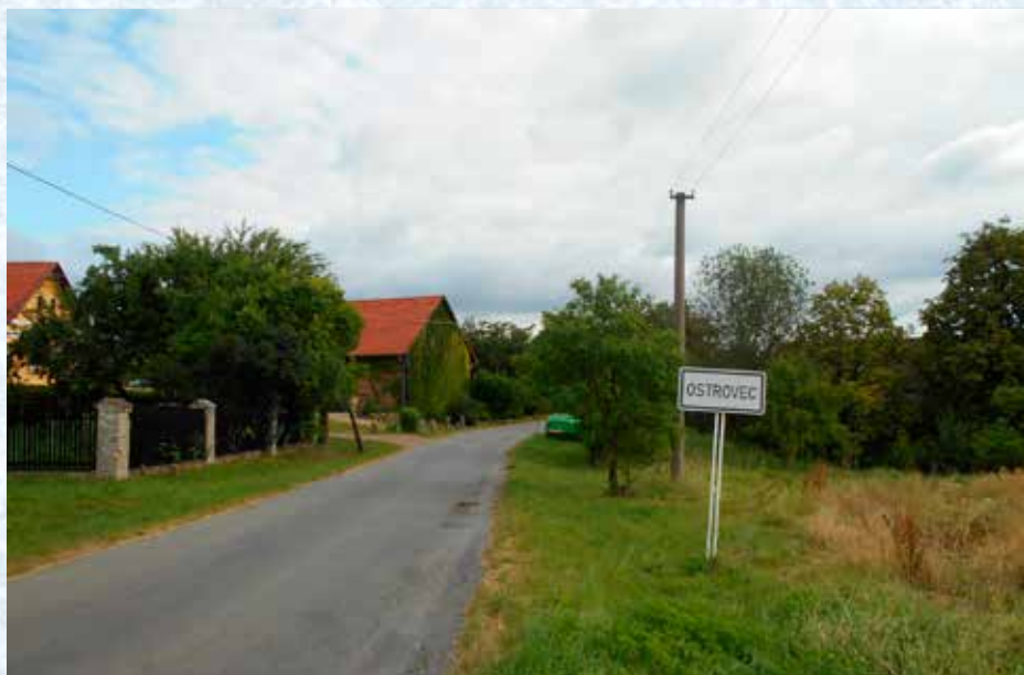
Příjezd do obce.