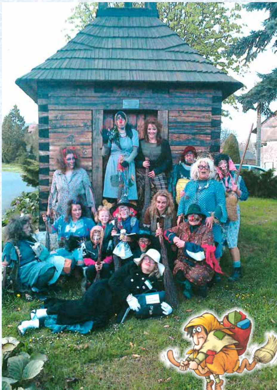
Slet čarodějnic před zvoničkou (2014).