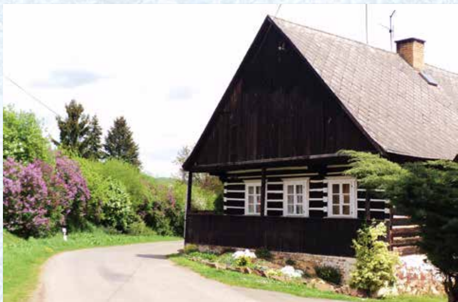
Roubenka č. p. 14 s pavláčkou na severní straně.