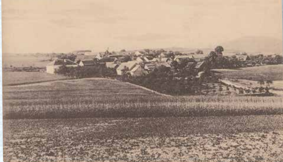
Celkový pohled na Ostrovec (1920).