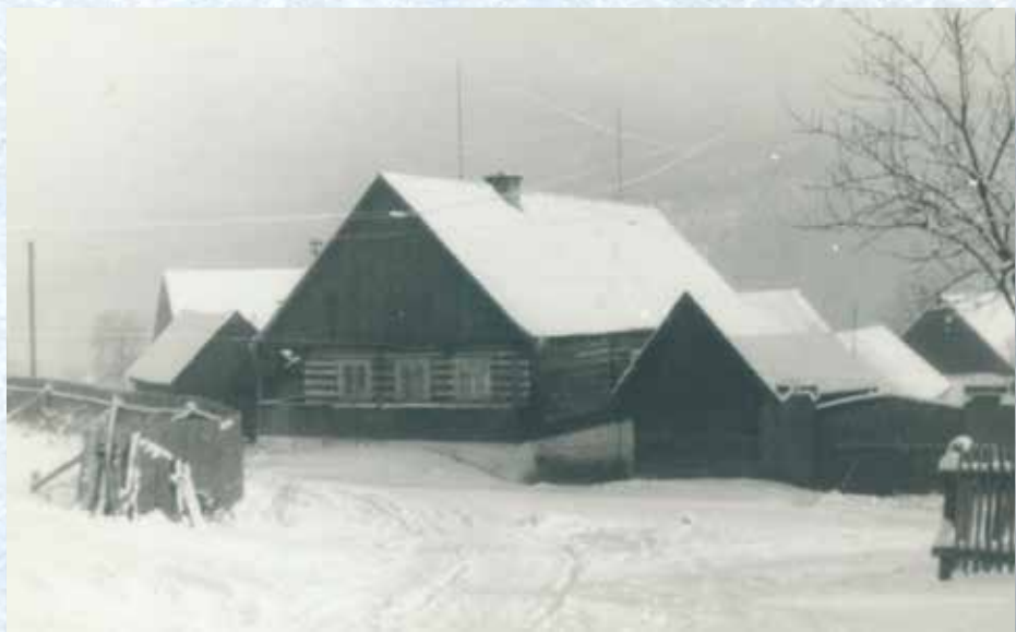
Dům č. p. 14 (20. léta 20. století).