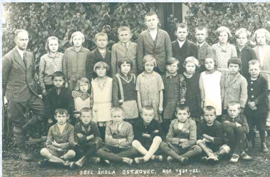
Školní rok 1931–32.