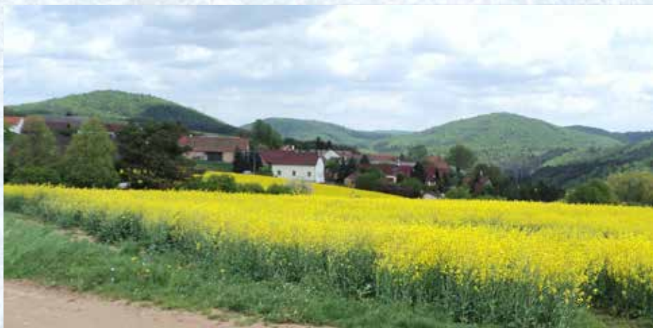
Jaro 2015 na Ostrovci.