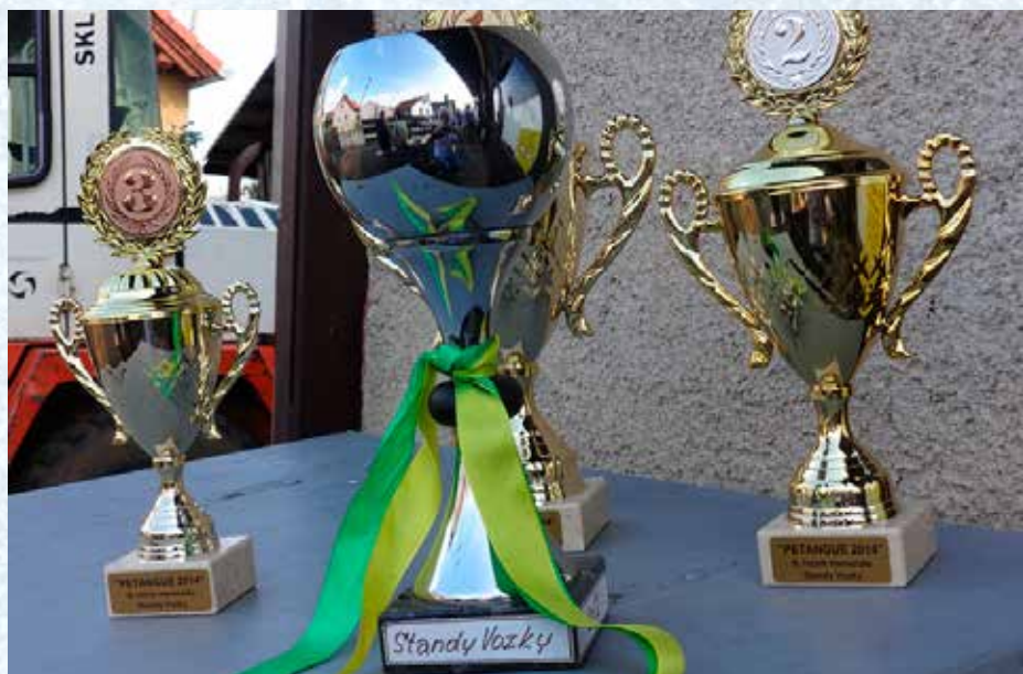
Memoriál Standy Vozky v petanque – trofeje pro vítěze.