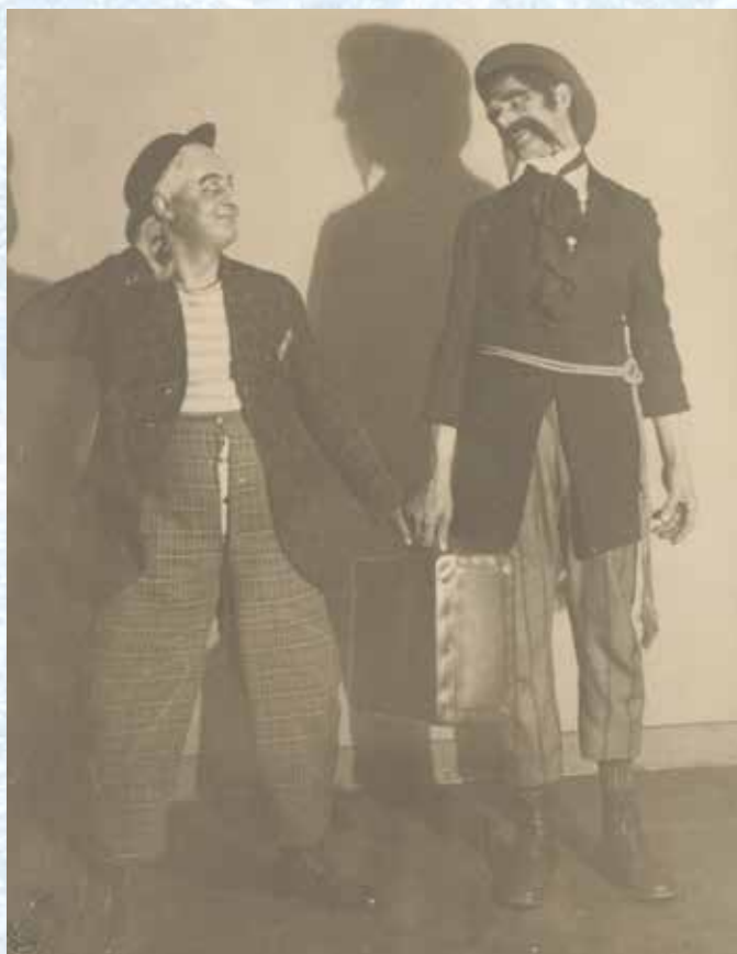
Ostrovectí ochotníci v sále hostince U Pazáků (30. léta 20. století).

Většina představení se odehrávala v sále v hospodě U Pazáků, hrálo se i v přírodě. S postupujícím získáváním zkušeností začal spolek hostovat v blízkém i dalekém okolí a stal se jedním z nejlepších v celém kraji. Za dobu svého působení odehráli členové asi 200 her, kabaretů a operet. V plném počtu účinkujících spolek fungoval do roku 1930, v menším počtu hráli do roku 1949. V období po 2. světové válce vedení spolku převzal Československý svaz mládeže. Pro značný pokles počtu obyvatel v obci a jejich nepříznivou věkovou strukturu nebyla činnost ochotníků fakticky již nikdy obnovena. V souvislosti s divadelním spolkem stojí za zmínku ještě korunová sbírka na Národní divadlo, která s největší pravděpodobností proběhla i na Ostrovci. Byla vydána publikace ke 100. výročí Národního divadla, podklady k ní poskytli kronikáři řady obcí, mezi které patřil i Ostrovec.