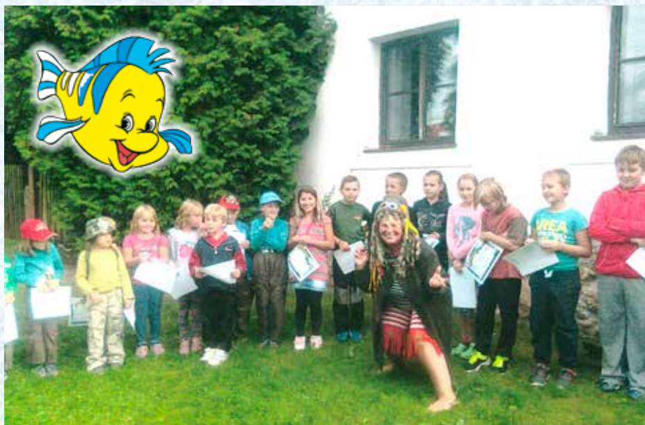
O zlatou rybku (2014).