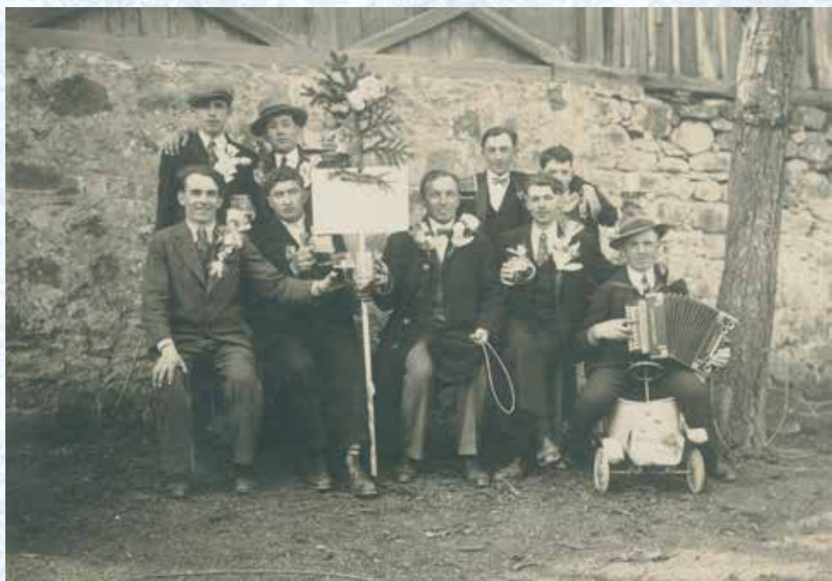
Svatba na Ostrovci (30. léta 20. století).