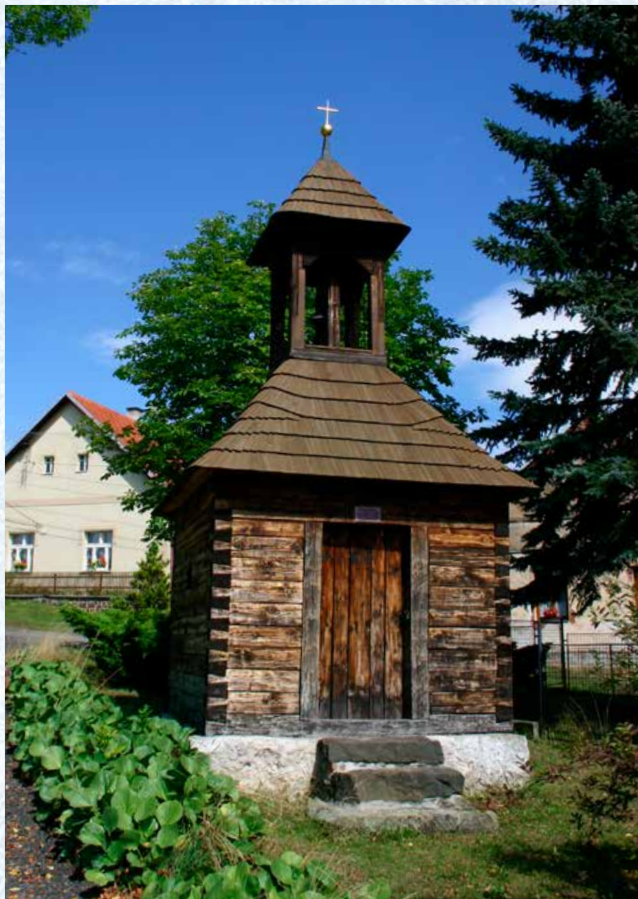
Zvonička v současnosti.