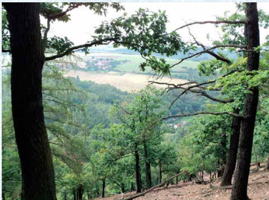
Ostrovec z Brahu.

Ostrovec je ves prastará, podle zmínky v darovací listině byla knížetem Vladislavem darována benediktinskému Kladrubskému klášteru u Stříbra roku 1115. Archeologický výzkum, který zde proběhl v roce 1997, potvrdil, že na východní straně návsi stávala dřevěná věžová stavba – tvrz drobné šlechty předhusitské doby.