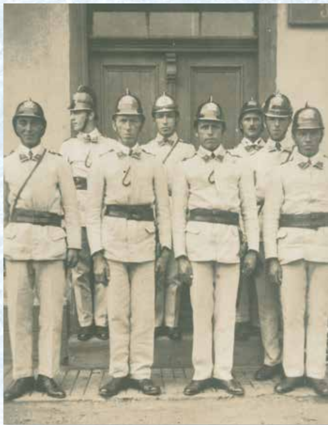
Členové Sboru dobrovolných hasičů Ostrovec (1914).